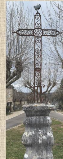
Croix, place du village à Carluccet.

Nous souhaitons vous donner l'envie tout simplement de les regarder et peut-être de les admirer.