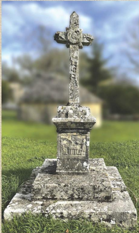
Croix du hameau de Montantay - Gramat (protégée au titre de Monument historique)